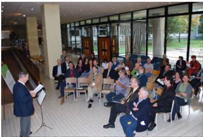
L'assistance lors du dévoilement de la plaque

À d'autres de composer d'autres couplets et d'autres refrains!